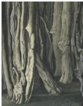
Léon Spilliaert "Bomen" 1938