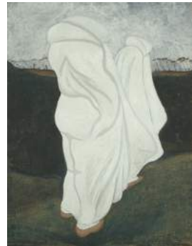
Léon Spilliaert "De gewaden" 1912