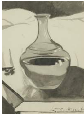
Léon Spilliaert "Karaf op Nachttafel" 1909-1909