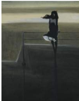
Léon Spilliaert "De Windstoot" 1904