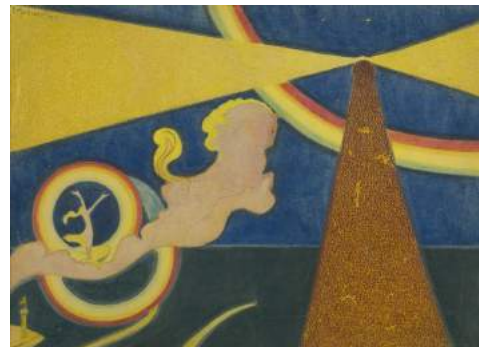
Léon Spilliaert "De vuurtoren" 1910