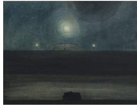
Léon Spilliaert "Strand bij maneschijn" 1908