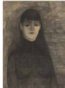
Léon Spilliaert "Melancholie" 1928