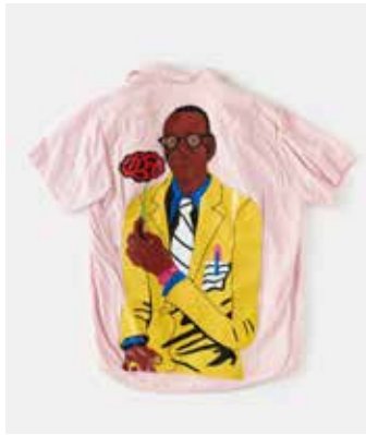
La Maitrise "Chemise illustrée" 2015