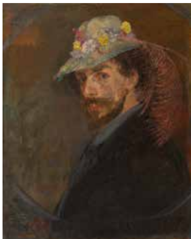
James Ensor "Zelfportret met Bloemenhoed" 1883-1888