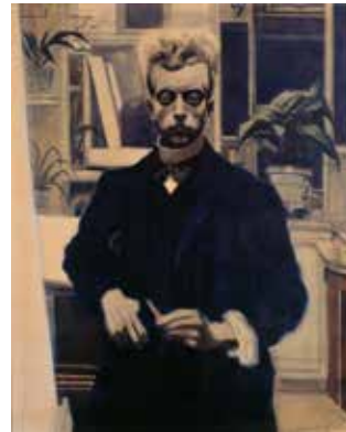
Léon Spilliaert "Zelfportret met rood potlood" 1908